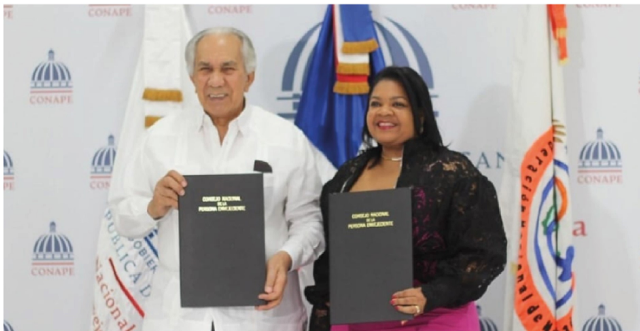
Acuerdo de colaboración de CONAPE y FENAMUTRA

el Hogar, dirigido a trabajadoras domésticas y cuidadoras, para que se puedan capacitar mediante charlas y talleres sobre los posibles riesgos en su entorno laboral, sobre el seguro de riesgos laborales, entre otros temas.