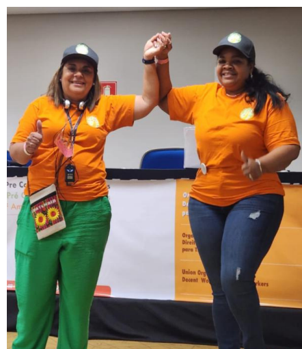
Pre-Congreso FITH 2023

La Federación Internacional de Trabajadoras del Hogar (FITH) en su segundo congreso en 2018, preocupada por el contexto y la relación del Trabajo Doméstico y el medio ambiente, se abocó a una enérgica Resolución sobre "Promover la Protección del Medio ambiente a través de la reducción de residuos y el reciclaje". teniendo en cuenta que, en muchos países de América Latina, los productos químicos peligrosos se lanzan a la naturaleza, a menudo con graves consecuencias para los seres humanos y el medio ambiente natural al causar un riesgo químico. Dependiendo del producto, las consecuencias pueden ser graves problemas de salud para los trabajadores y la comunidad y daños permanentes al medio ambiente natural. Hoy en día, casi todos los trabajadores están expuestos a algún tipo de riesgo químico porque los productos químicos peligrosos se utilizan en casi todas las casas.