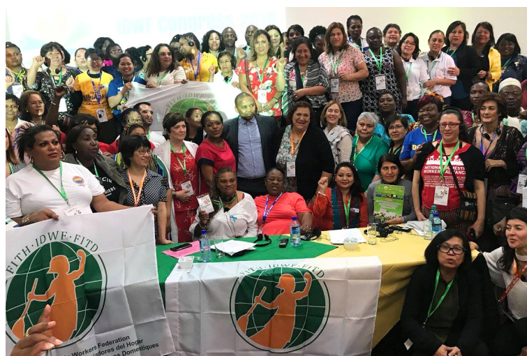
Congreso FITH 2018