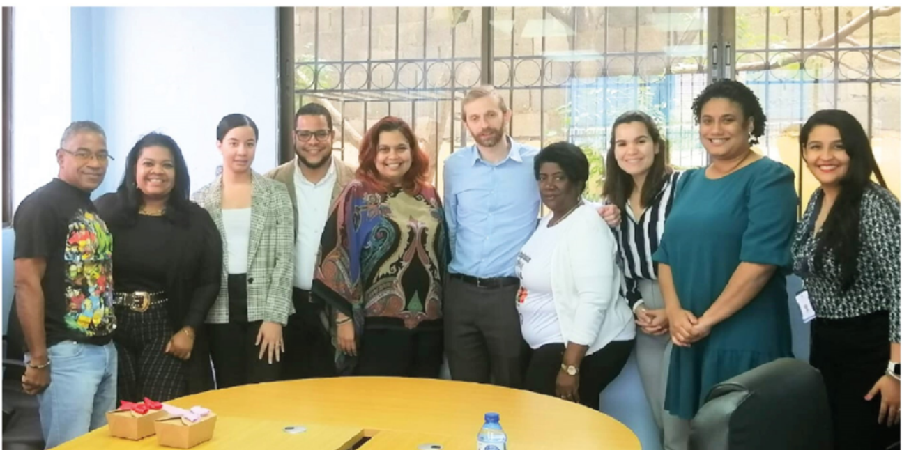
Mesa de Cuidados de República Dominicana

La federación, en un inicio abordaba el tema de las capacitaciones únicamente para el trabajo doméstico, pero en la actualidad se ha ampliado la oferta formativa del centro, el cual cuenta con el aval del Instituto Nacional de Formación Técnico Profesional (INFOTEP) técnica y jurídicamente para abordar la formación en cuidado de niños, adultos mayores y primeros auxilios. De igual manera, FENAMUTRA cuenta con la colaboración del Instituto Dominicano de Prevención y Protección de Riesgos laborales (IDOPPRIL), para la implementación de un Programa Especial de Prevención de Riesgos Laborales en